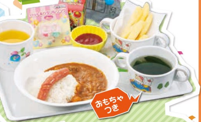
おこさまカレー 480円(税込)

※キッズメニューのご注文は、小学生以下のお子さまに限らせていただきます。 ※料理内容が一部変わることがあります。 ※写真はイメージです。