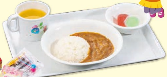
低アレルギーカレー 580円(税込)