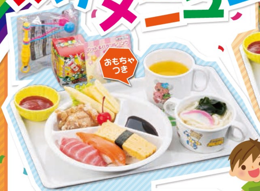
おこさますしランチ 480円(税込)