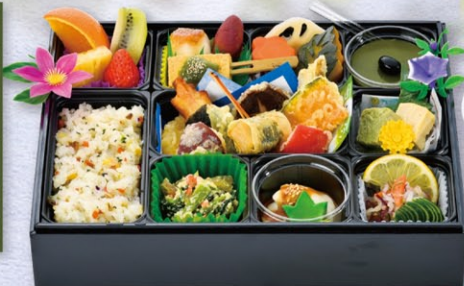
S-3 精進料理 2,300円 (税込)