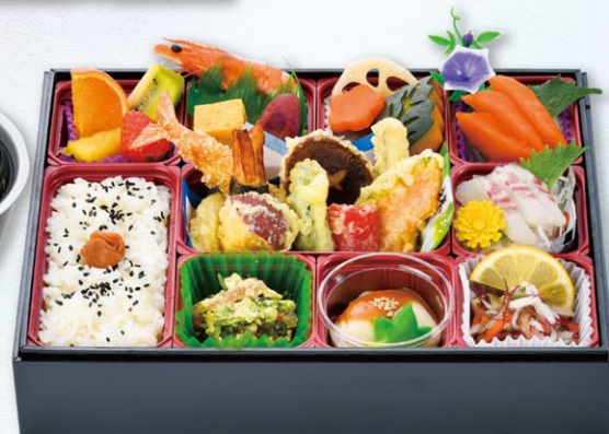
K-3 精進落とし料理 2,300円 (税込)