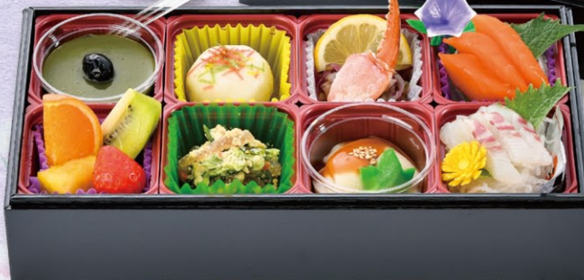
K-2 精進落とし料理 2,800円 (税込)