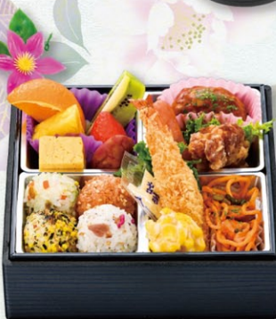
K-4 子供用弁当 1,300円 (税込)